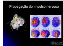
Propagação do impulso nervoso

Uma técnica neurofisiológica, EMT, gera-se um campo magnético em áreas específicas do córtex para influenciar a atividade elétrica do cérebro. Este é um procedimento não invasivo.